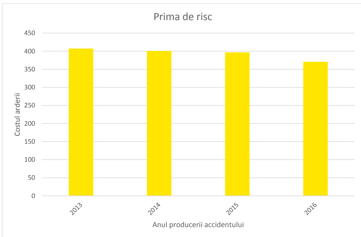
Figura 3.2.4.: Prima de risc pe an de accident

N.B.: Anul accidentului 2017 a fost exclus din toate ilustrațiile grafice, deoarece este relativ nedevoltat și, așadar, ar furniza o potențială imagine deformată asupra frecvenței, severității și primei de risc.